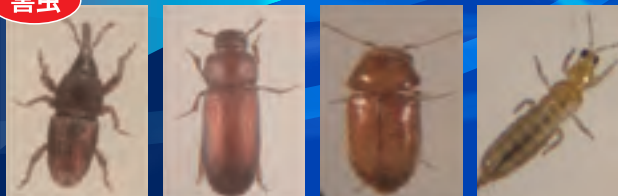
ココクゾウムシ コクヌストモドキ タバコシバンムシ ミカンキイロアザミウマ