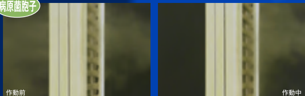
緑かび病菌の孢子